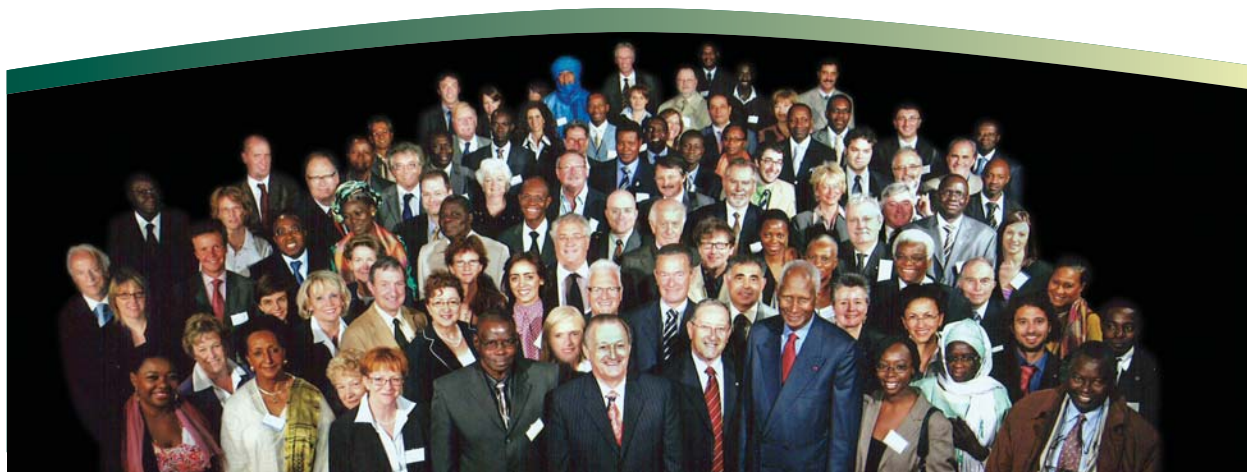
Les représentants de l'OIF et des OING présents à la réunion de la VI e Conférence.

Pour lire les contributions des autres OING, veuillez vous rendre sur le site Web du Carrefour des OING à l'adresse suivante : ong-francophonie.net .