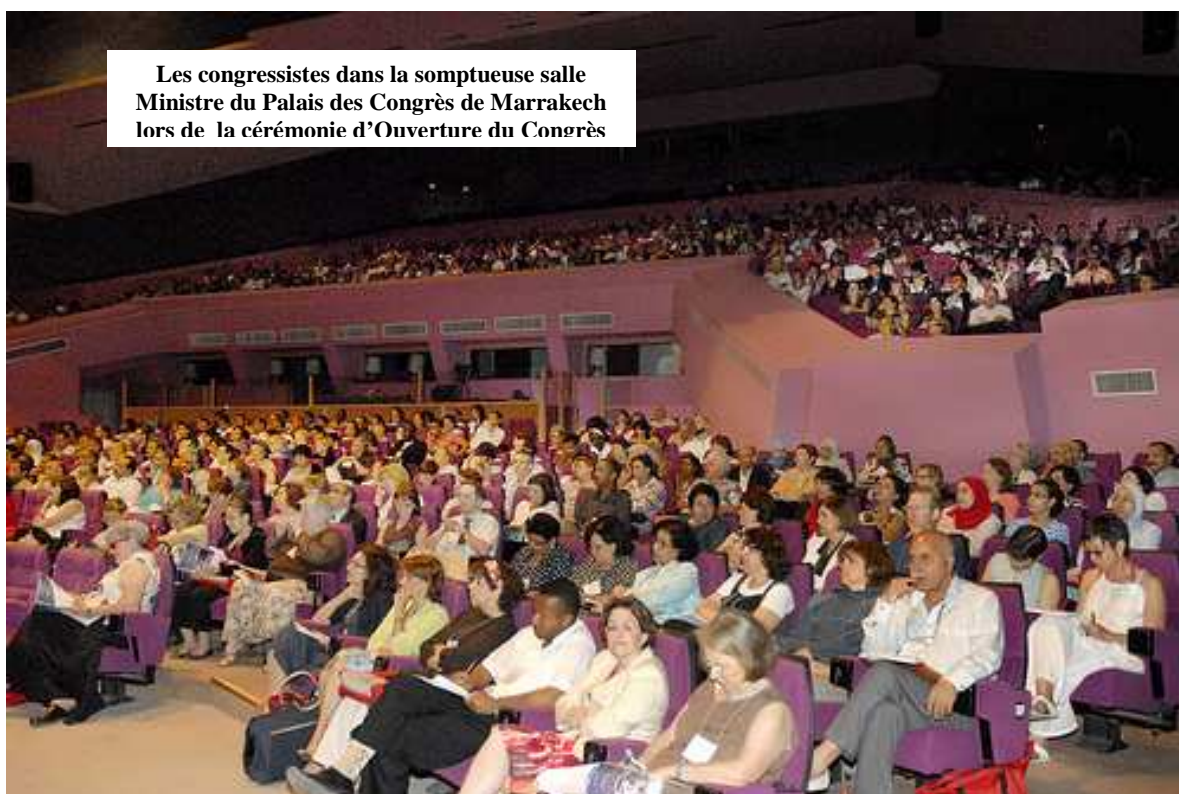
Les congressistes dans la somptueuse salle Ministre du Palais des Congrès de Marrakech lors de la cérémonie d'Ouverture du Congrès

Placé sous le haut patronage de son Altesse Royale, la Princesse LALLA SALMA, et organisé avec la collaboration de l'Association Marocaine des Sciences Infirmiers et Techniques Sanitaires (A.M.S.I.T.S) et l'Association LALLA SALMA de lutte contre le cancer (ALSC), il a duré cinq jours, du 7 juin au 11 juin 2009. Il a réuni plus de 1500 participants venus des différents continents de l'espace francophone.