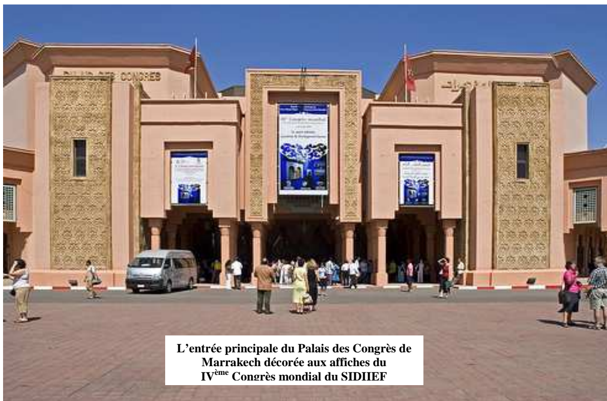
L'entrée principale du Palais des Congrès de Marrakech décorée aux affiches du IV ème Congrès mondial du SIDIIEF

Ville envoûtante et attirante avec ses grands complexes hôteliers et ses grands restaurants, Marrakech fait rêver tous ceux qui foulent son sol. C'est dans cette ville emblématique que le SIDIIEF a choisi d'organiser son IV ème Congrès mondial. Le site choisi pour abriter ce congrès est le Palais des Congrès de Marrakech situé à l'angle des avenues Mohamed IV et Moulay El Hassan. Joyau architectural, cet édifice à la pointe de la haute technologie de la communication, a permis au SIDIIEF de recevoir tous les congressistes repartis dans différentes salles de conférences pour leurs différentes présentations.