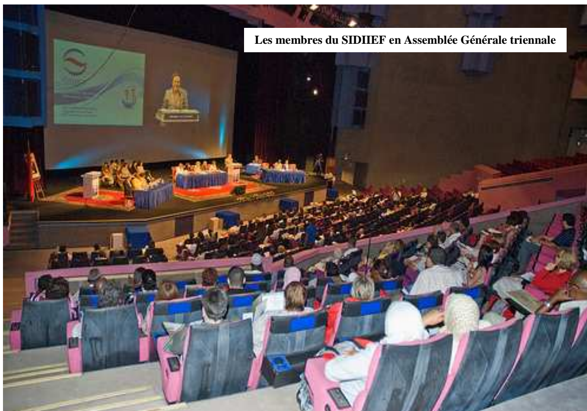
Les membres du SIDIIEF en Assemblée Générale triennale

Après donc ces éclaircissements apportés par le Président et le Secrétaire du RANIAF pour élucider ces différents points d'ombres, tous les participants ont pu accorder leurs violons et l'AG s'est terminée dans une très bonne ambiance.