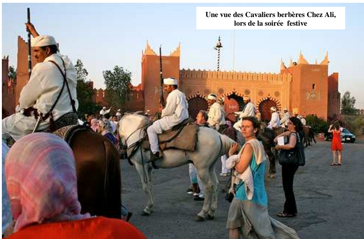
Une vue des Cavaliers berbères Chez Ali, lors de la soirée festive

Après ces intenses journées d'échange de connaissances et d'expériences, c'est le somptueux cadre chez ALI qui a été le lieu choisi pour le divertissement des participants au congrès du SIDIIEF. Après 15mn de route à bord des somptueux cars affrétés pour la circonstance, nous sommes arrivés chez ALI où une haie de cavaliers berbères nous a accueillis. Après une visite de ce somptueux palais, les hôtes d'ALI ont été installés sous des tentes où ils ont savouré le riche folklore et les mets berbères. Cette soirée s'est terminée par des exercices de démonstration des habiletés des cavaliers berbères.